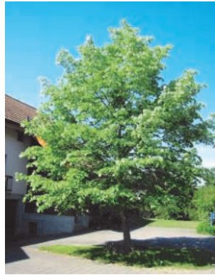
Die Linde ist ein Haus- (oder Hof-) baumkandidat, wenn etwas mehr Platz zur Verfügung steht

Unsere Vorfahren sagten dem Hausbaum allerlei mystische Bedeutungen und Wirkungen nach. So sollte er, im Allgemeinen vor Unheil schützen, beispielsweise vor Blitz, Donner und Unwetter aber auch vor Hexen und bösen Geistern. Diese