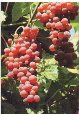
„Vanessa“ - Neuheit! Erste roséfarbene, pilzfeste und kernlose Sorte

Keine andere Pflanze symbolisiert das Bild vom mediterranen Süden mit üppigen Früchten und sonniger Gelassenheit mehr als der Wein. Und das Beste ist: Schon eine warme Hauswand genügt, um auch im eigenen Garten von süßen Trauben nicht nur zu träumen.