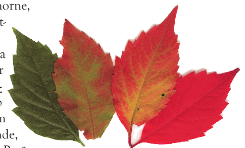
Der Wilde Wein (Parthenocissis quinquefolia) spielt so richtig mit Farben