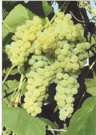
„Lakemont“ - neue kernlose und pilzfeste Sorte aus den USA

Eine mit Reben berankte Pergola ist nicht nur der perfekte Rahmen für fröhliche Stimmung in lauen Sommernächten, sie dient den Blattranken der kletternden Triebe auch als willkommener Halt auf dem Weg zur Sonne. Im Schutz der Hauswand oder eines lichten Daches reifen blaue, rote und weiße Trauben im Spätsommer als süßer Trost