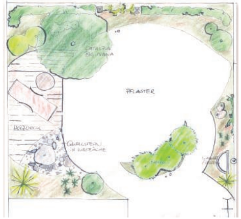
Gut geplant ist halb gebaut

und Oberfläche den Charakter des Gartens entscheidend mit. So kann das Material einer Pergola, zum Beispiel Edelstahl oder Holz, den Charakter eines Gartens entscheidend prägen.