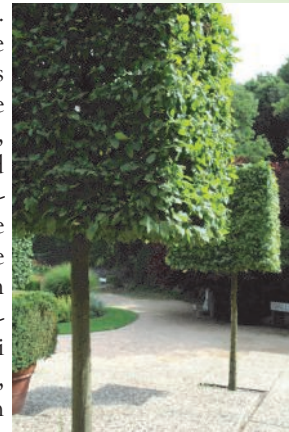
So geht's natürlich auch: in Form geschnittene Hainbuchen (Carpinus betulus)

Arten geeignet. Als Beispiele seien hier, als Nadelgehölze noch Lärche, Tanne und Kiefer genannt, sowie der urzeitliche Ginkgo. Am Besten kommen Sie bei uns vorbei, lassen sich von unseren Fachleuten beraten und suchen sich Ihren Baum gleich aus.