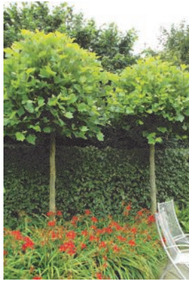
... oder die Kugelplatane (Platanus his., ‚Alphens Globe‘)

Zur Vermeidung nachbarschaftlicher Streitigkeiten sollte man genügend Abstand zu den angrenzenden Grundstücken halten. Ist die