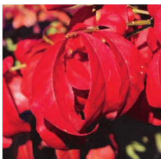
Der Klassiker unter den Herbstfärbern, und immer wieder schön: Euonymus alatus (der Korkflügelstrauch)

Um alle Jahreszeiten im Garten genießen zu können, dürfen also auch Pflanzen nicht fehlen, die ihren besonderen Reiz im Herbst mit auffälliger Blattfärbung entfalten.