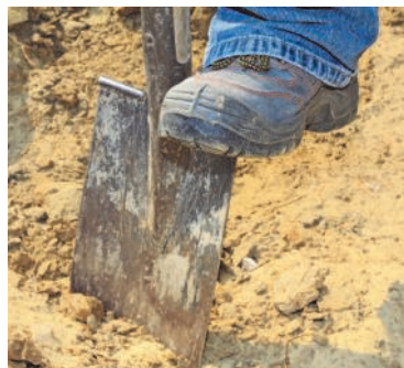
Oftmals die Beste Lösung: ein Erd-austausch

wickeln und kümmern. Weitere Ursachen können auch sein: einseitiger Nährstoffzug, Änderung des pH-Wertes im Boden, Anhäufung von Schädlingen im Boden oder Artenrückgang der Bodenlebewesen