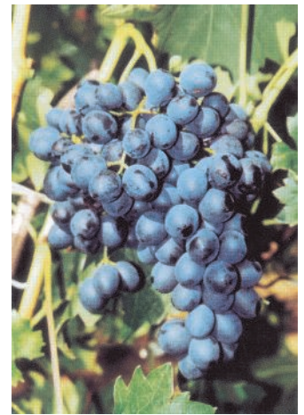
„Muscat Bleu“ - inzwischen die blaue pilzfeste Standardsorte aus der Schweiz

Lassen Sie sich bei uns beraten, welche Sorte für Sie die Beste ist.