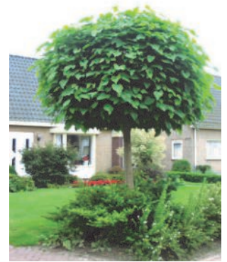
„Platzsparend“ sind auch Kugelbäume wie hier der Kugel-Trompetenbaum (Catalpa b. Nana) ...

Individuelle Auswahl ermöglicht es, den Wunsch nach Habitus, Blütenfarbe, Herbstfärbung (Beobachtung des Wandels im Jahresverlauf), Duft oder der Ernte von Früchten zu erfüllen. Dadurch, dass er auf dem Schnittpunkt zwischen innen und außen steht, stellt er für den Menschen die Verbindung dieser Bereiche her. Aus der Summe all dieser Effekte kann sich eine posi-