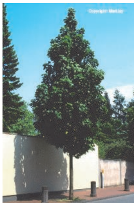
Der schmalkronige Spitzahorn (Acer plat. Columnare) kommt auch mit wenig Platz aus

Daneben hat die Bedeutung des Hausbaumes heute vor allem ganz pragmatische Gründe. Prinzipiell wird der Hausbaum vor dem Haus gepflanzt, oder jedenfalls so, dass er schon aus der Entfernung bestimmbare sichtbar ist und meist den Eingangsbereich betont. So verleiht er dem Haus individuellen Charakter, Unverwechselbarkeit, die auch als Orientierung dient und er vermittelt Geborgenheit (Am Brunnen vor dem Tore ...). Bewohnern und Gebäude kann er Schutz vor Wind und Wetter bieten und Schatten spenden. So verbessert sich auch das Kleinklima durch die Temperatur ausgleichende Wirkung und den Verdunstungsschutz, die Staubfilterung führt zur Verbesserung der Qualität der Atemluft. Sein dichtes Laub kann auch schalldämpfende Wirkung haben und hässliche Flächen und unschöne Fassadenpartien verdecken.